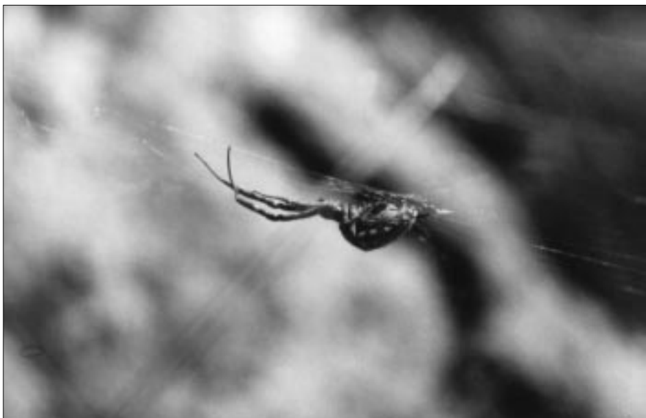
6. ábra: Derespók ( Uloborus walckenaerius )