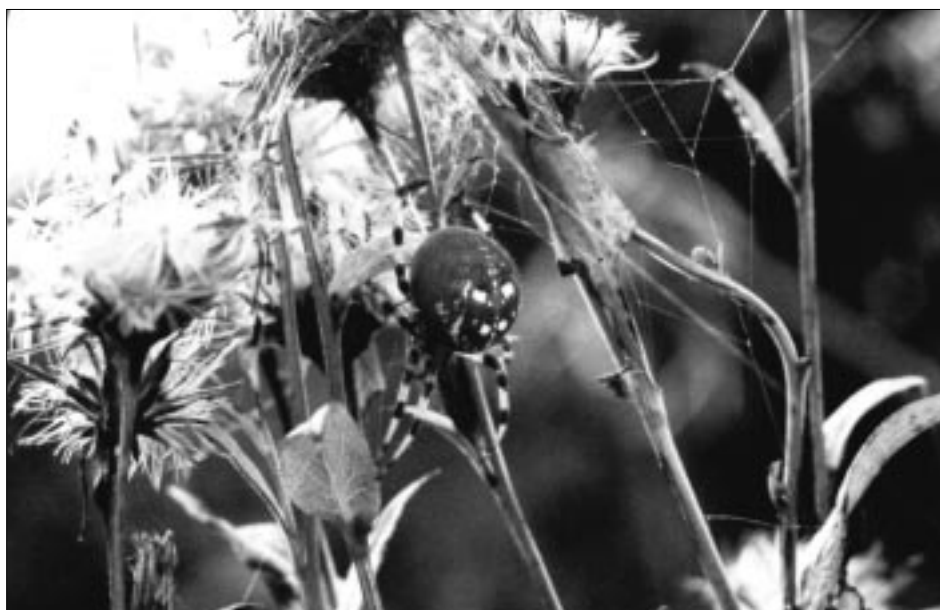
1. ábra: Négyes keresztspók ( Araneus quadratus )